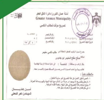
التصريح الجديد ( بطاقة ممغنطة )