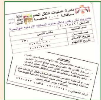
التصريح القديم ( كرت )